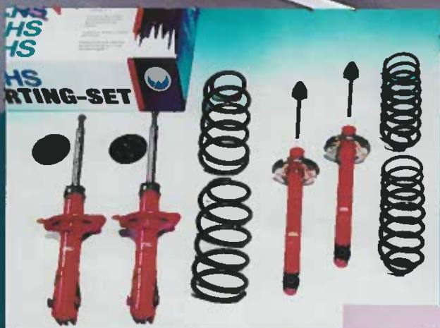
HEICO Sportfahrwerk, 35 mm kürzere Federn und Dämpfer, für S/V40, 850 und S70 / V70 DM 1.850,- incl. MwSt. (S/V40 DM 1.780,-)