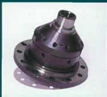
HEICO Differentialsperre, 0-40% gesperrt, für Volvo S/V40 T-4, 850 und S70 / V70 mit manuellem Getriebe DM 2.650,- incl. MwSt.